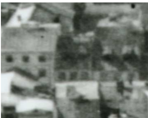
Fragment panoramy lublina, lata 30., Szeroka 18/A fragment of panorama of Lublin in the 1930s, Szeroka 18,