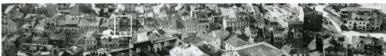
Fragment panoramy lublina, lata 30., ul. Szeroka/A fragment of panorama of Lublin in the 1930s, Szeroka street,