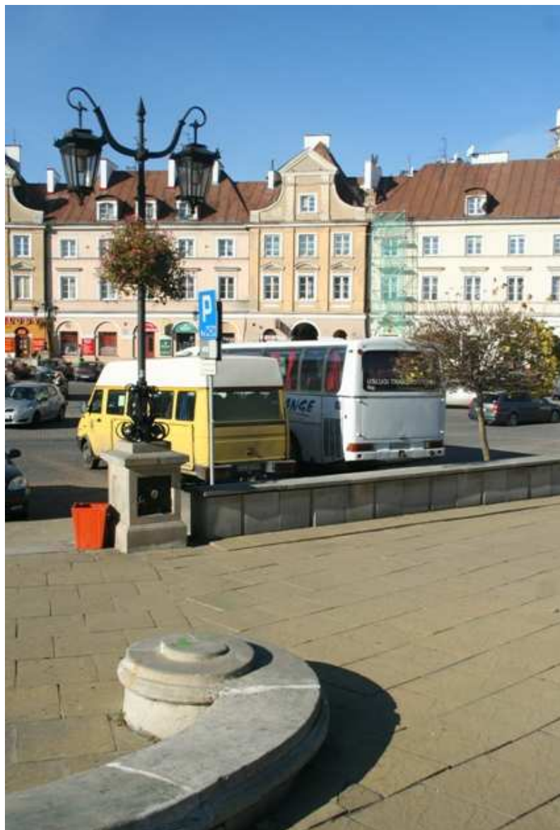
Szeroka 18, fot. Marcin Fedorowicz, 2010.